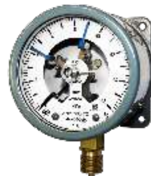
РАДИАЛЬНОЕ РАСПОЛОЖЕНИЕ ШТУЦЕРА, С ЗАДНИМ ФЛАНЦЕМ